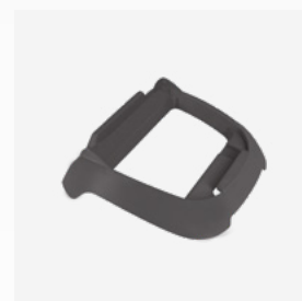
Base para unidad de control