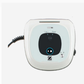
Unidad de control